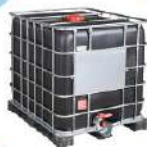
Cuve 1000 L