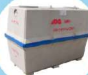
Cuve 3000 à 8000 L