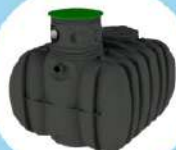
Cuve 3000 à 8000 L